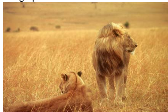
Leeuwen in de Masai Mara

Het is juist in dit gebied dat de titel van de reis het best tot haar recht komt en we sluiten hier danook af met een echt hoogtepunt.