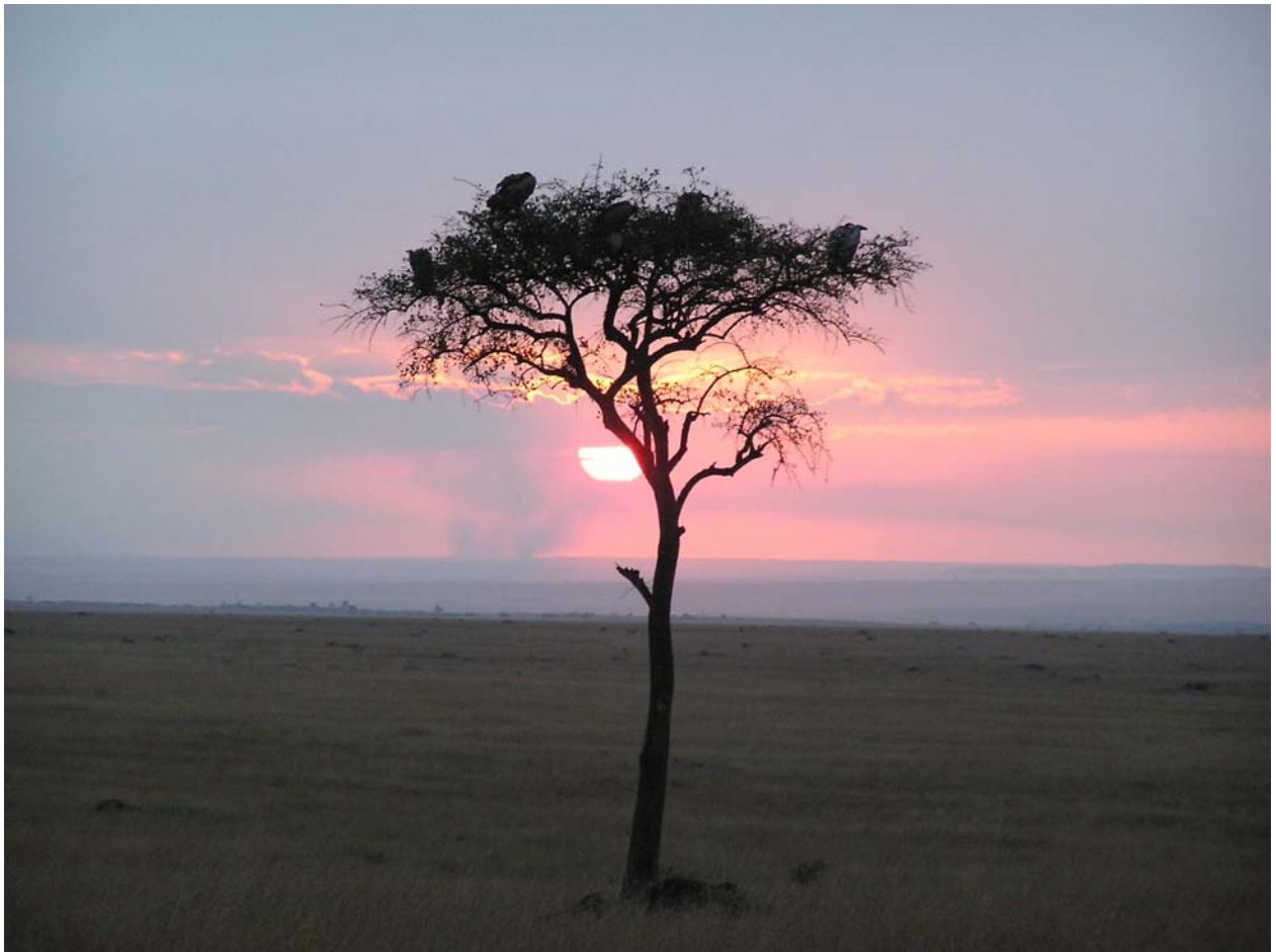
Zonsondergang over de Masai Mara