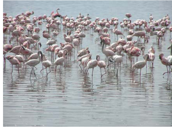
Lesser en Greater Flamingo's

We verlaten de bergen en gaan op weg naar een van de beroemdste vogelmeren ter wereld, Lake Nakuru. We overnachten in het Flamingo tented Camp en dit heet niet toevallig zo. Nakuru is uiteraard beroemd om zijn (honderd)duizenden Lesser Flamingo's.