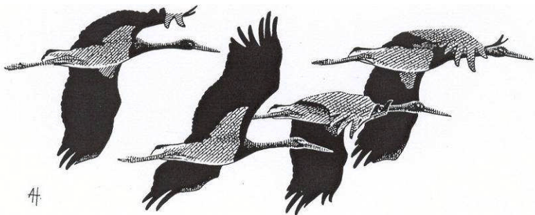
Zwarte Ooievaars op trek langs de baai van Kallonis

We vertrekken vanaf Amsterdam/Schiphol-Airport naar Lesbos, vanwaar we met de transferbus naar ons hotel vervoerd worden, rustig gelegen aan de baai van Kallonis, centraal op het eiland. In de namiddag staat een wandelexcursie geprogrammeerd. Deze activiteit is afhankelijk van het tijdstip van aankomst op het eiland. Tijdens deze oriëntatie kunnen mogelijk reeds soorten gezien worden als Ralreiger, Zwarte Ibis, Slangenarend, Strandplevier, Krombekstrandloper, Alpengierzwaluw, Roodstuitzwaluw, Grauwe Klauwier en Europese Kanarie. Bij de start van deze reis ontvangen belangstellenden een speciaal op dit reisdoel toegesneden vogelwaarnemingenlijst. Hierop kan bijgehouden worden welke soorten zijn waargenomen. 's Avonds wordt de lijst met 'de liefhebbers' gezamenlijk ingevuld.