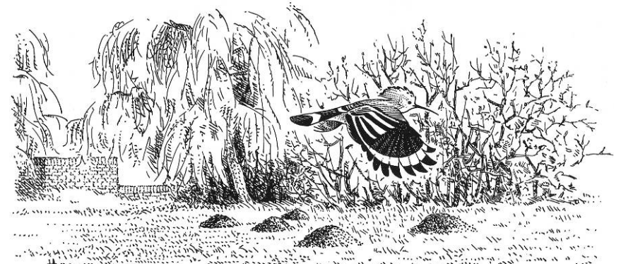
Net buiten Molivos kruist een Hop ons pad

'beklimmen' we, over een smal weggetje, de Ipsilou berg, met het gelijknamige klooster bovenop. Onder andere op deze plaats zoeken we naar de weinig opvallende Smyrnagors. Daarna stoppen we o.a. bij wat veelbelovend 'het versteende woud' heet. In het landschap treft men echter slechts enkele uitgegraven, versteende boomstammen van behoorlijke doorsnede aan, die enkele meters lang zijn en dus enkele meters diep in de grond staken. Van een 'woud' is in het geheel geen sprake. Uiteindelijk gaan we over het schilderachtige kustweggetje van het eveneens nog ingeslapen Sigri naar Eresos terug. Een verlaten en landschappelijk zeer fraaie route trakteert ons waarschijnlijk op tal van mooie vogels! We kunnen vandaag misschien genieten van Kuifaalscholver, Purperreiger, Kleine Torenavalk, Slechtvalk, trek van Oever-, Boeren-, Roodstuit-, Huis-, en Gierzwaluw, zingende Bruinkeelortolaan, Scharrelaar en verschillende soorten klauwieren en vliegenvangers.